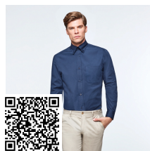
AIFOS L/S CM5504