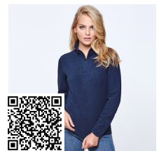
HIMALAYA WOMAN SM1096