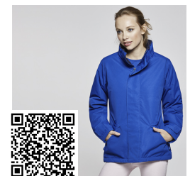
EUROPA WOMAN PK5078