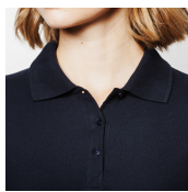
Duo Concept PO6638