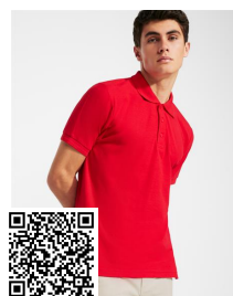
PEGASO PREMIUM PO6609