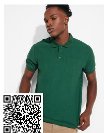
CENTAURO PREMIUM PO6607