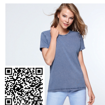
HUSKY WOMAN CA6691