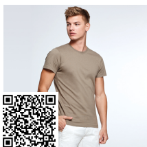
DOGO PREMIUM CA6502